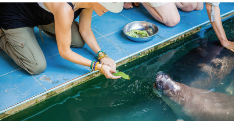
Centre de Sauvetage de Lamantins

Note : Cette destination est incluse dans le dernier jour de tous nos itinéraires