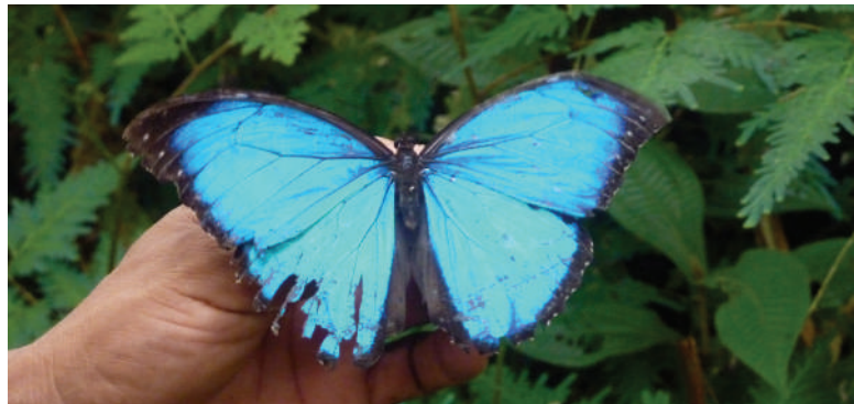
En savoir plus sur les papillons et autres créatures de la jungle à Pilpintuwasi

Juste à côté de Pilpintuwasi se trouve l'orphelinat des animaux d'Amazonas. Ici, l'équipe travaille dur pour sauver et réhabiliter les animaux qui ont été sauvés de servir d'animaux domestiques ou de nourriture. Les favoris sont les fourmiliers, les singes, les tapirs, les jaguars, les aras et plus encore.