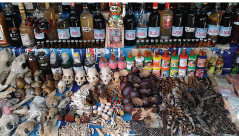
Marché flottant "Belén"

Votre guide vous emmènera au marché Nanay où il est dit que les indigènes se sont réunis pour fonder la ville d'Iquitos il y a de nombreuses années. Il y a aussi un petit port animé de peque-peques, des bateaux en bois colorés, où les habitants s'embarquent pour se rendre dans les communautés voisines. Le marché Nanay est aussi un endroit agréable à explorer, et votre guide vous indiquera les aliments locaux tels que les vers suri marinés, les lézards alligators grillés, les boules de banane: tacacho, filets de viande de bœuf séchée et fumée et jus de fruits naturels tels que le camu camu et la cocona.