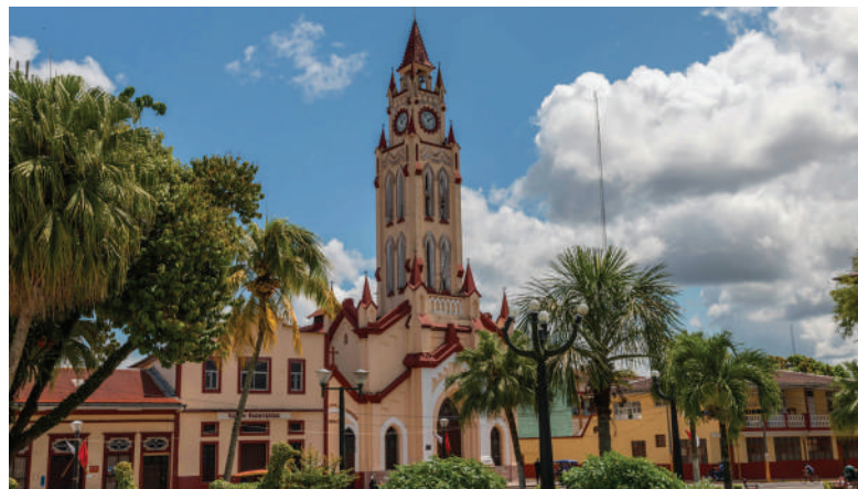
Plaza de Armas et église principale d'Iquitos

En plus de profiter du paysage tranquille ou de vous immerger dans l'un des bars et cafés locaux, c'est l'endroit idéal pour socialiser, se détendre et partager des idées.