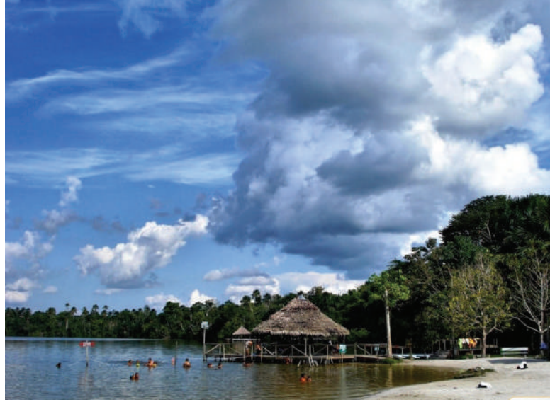
La plage de Tunchi est très populaire pour se rafraîchir

A environ 6,3 kilomètres (4 miles) à l'extérieur d'Iquitos, c'est un endroit où vous pouvez voir de nombreux animaux rares qui se trouvent dans la forêt amazonienne qui vous entoure. Son nom vient de la lagune de Quistococha abritant des créatures telles que des jaguars, des ocelots et des marguay (grands félins !), Plusieurs espèces de singes, des poissons arapaima géants et d'autres animaux. Le serpentarium vous montrera des insectes rares et dans la volière il y a des oiseaux vivants de toutes les tailles et de toutes les couleurs. Si le climat de la jungle chaude et humide devient trop intense pour votre peau, vous ne pourrez pas résister à une baignade à la plage de Tunchi ! La plage artificielle tranquille du lac est entourée de protection et est une oasis agréable. La pêche et le kayak sont également proposés à Quistococha. C'est une destination idéale pour toute la famille !