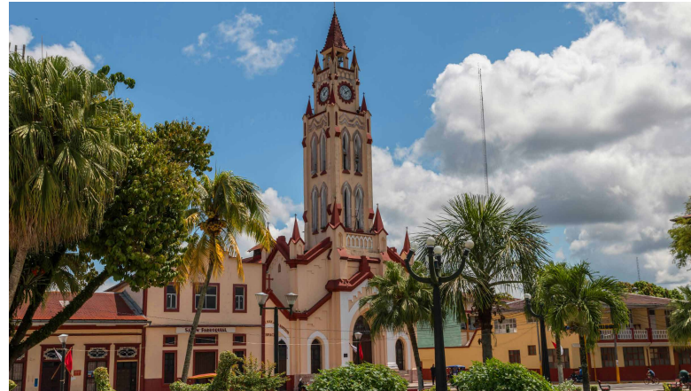
Plaza de Armas e Iglesia principal de Iquitos

Su día terminará con un paseo de Iquitos (Malecón Tarapacá) que se extiende a lo largo del río Tarapaca. Bordeando su lado occidental es una impresionante colección de arquitectura europea del siglo XIX, estéticamente fuera de lugar, construida durante el auge del caucho. Además de disfrutar del paisaje tranquilo o sumergirse en uno de los bares y cafeterías locales, este es el lugar perfecto para que la gente sociabilice, se relaje y comparta ideas.