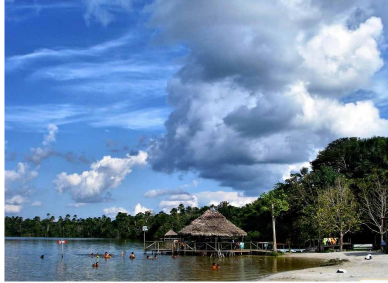
La Playa Tunchi es muy popular para refrescarse

Cerca de 6.3 kilómetros (4 millas) fuera de Iquitos es un lugar donde puedes ver muchos animales raros que se encuentran en la selva amazónica que te rodea. Su nombre proviene de la laguna Quistococha hogar de criaturas como jaguares, ocelotes y marguay (¡grandes felinos!), varias especies de monos, peces arapaima gigantes y otros animales. El serpentario verá insectos raros y en el aviario hay pájaros vivos de todos los tamaños y colores. Si el clima cálido y húmedo de la jungla llegara demasiado profundo a tu piel, ¡no podrás resistirte a un chapuzón en la Playa Tunchi! La tranquila playa artificial del lago está cercada por protección y es un oasis agradable. La pesca y el kayak también se ofrecen en Quistococha. ¡Este es un gran destino para toda la familia!