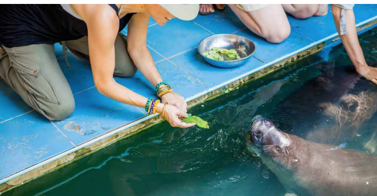
Centro de Rescate de Manatíes

Nota: Este destino está incluido en el último día de todos nuestros itinerarios.