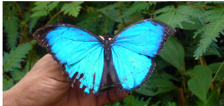
Aprenda todo sobre las mariposas y otras criaturas de la selva en Pilpintuwasi

Justo al lado de Pilpintuwasi se encuentra el Orfanato Animal de Amazonas. Aquí, el equipo trabaja duro para salvar y rehabilitar animales que han sido rescatados de servir como mascotas o comida. Los favoritos son los osos hormigueros, monos, tapires, jaguares, guacamayos y más.